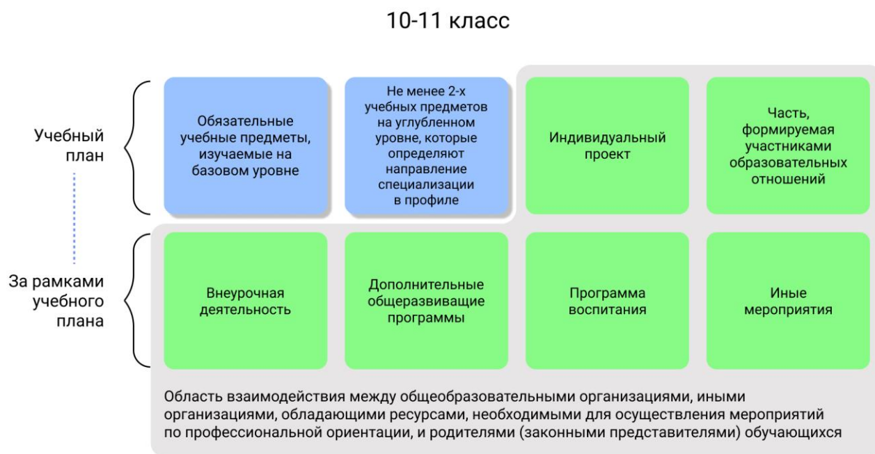
Рисунок 1 – Единая модель профориентации в профильных предпрофессиональных классах – область взаимодействия между общеобразовательными организациями и партнерами

Разработка основной образовательной программы для профильных предпрофессиональных классов проводится с учетом мнения всех категорий участников Единой модели профориентации, представленных на уровне субъекта Российской Федерации, муниципалитета.